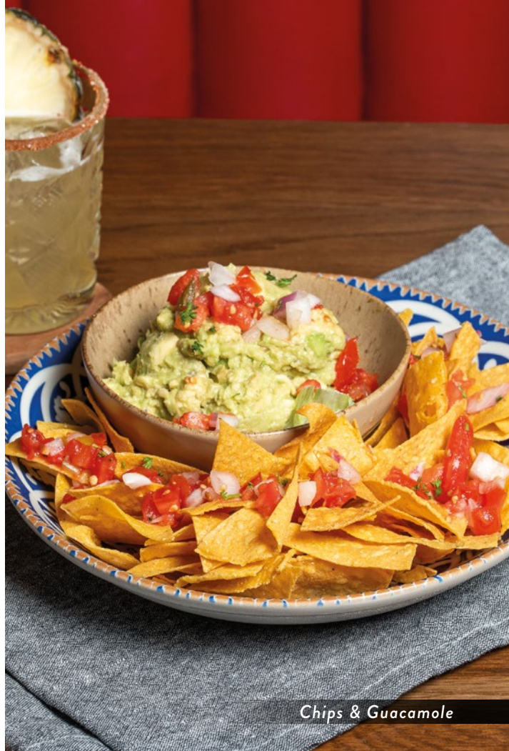
Chips & Guacamole

Αν και λαμβάνουμε όλα τα απαραίτητα μέτρα προστασίας, ενδέχεται κάποιο γεύμα να περιέχει ίχνος αλλεργιογόνων ουσιών όπως αυτά περιγράφονται στο παράρτημα II του κανονισμού 1169/2011. Καταναλώντας τους κινδύνους γι' αυτούς που έχουν σοβαρές αλλεργίες, το κατάστημα διαθέτει ξεχωριστό κατάλογο με τα αλλεργιογόνα συστατικά που υπάρχουν στα προϊόντα μας. Σε περίπτωση που είσαστε αλλεργικοί σε κάποιο συστατικό, παρακαλούμε να ζητήσετε να μιλήσετε με τον υπεύθυνο της βάρδιας που μπορεί να σας προσφέρει κάθε σχετική πληροφορία προκειμένου να κάνετε την επιλογή σας.