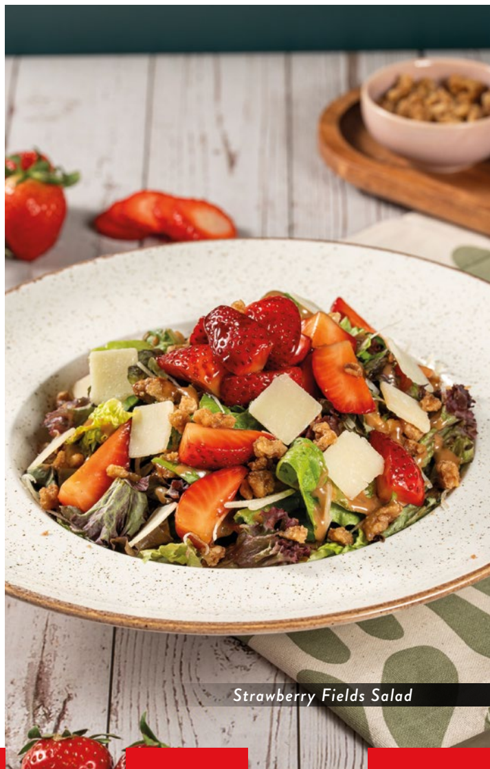
Strawberry Fields Salad