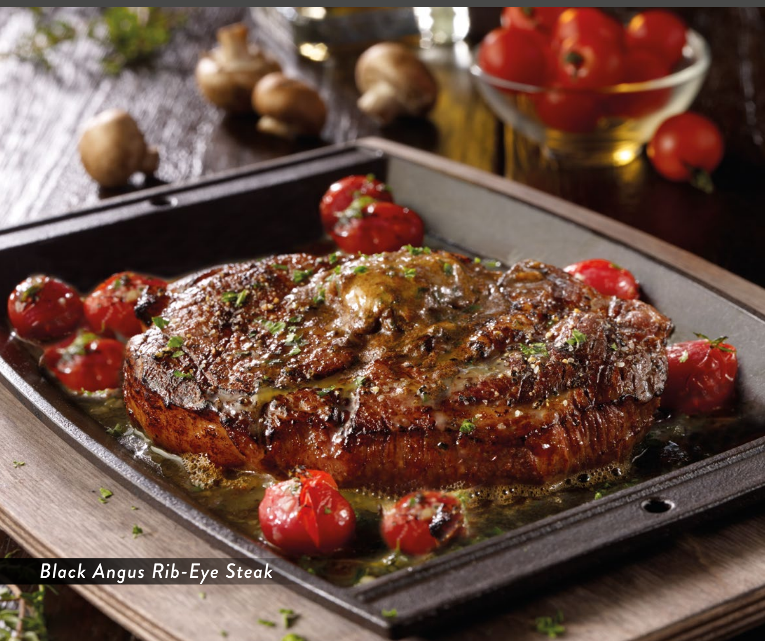
Black Angus Rib-Eye Steak