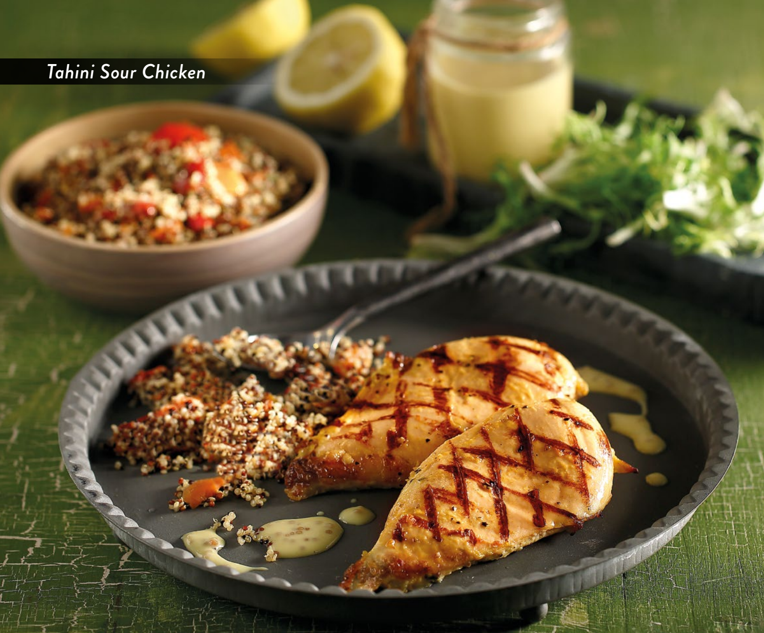
Tahini Sour Chicken