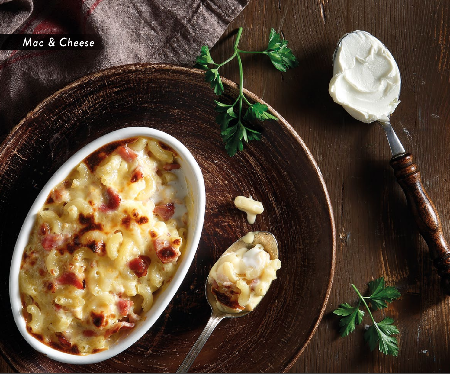
Mac & Cheese