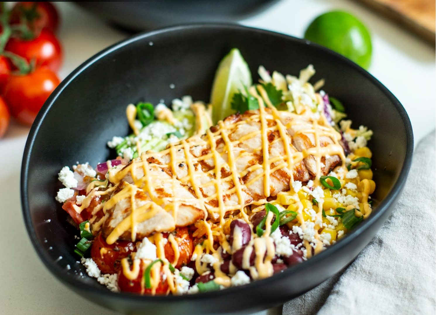
Mexican Bowl with Chicken