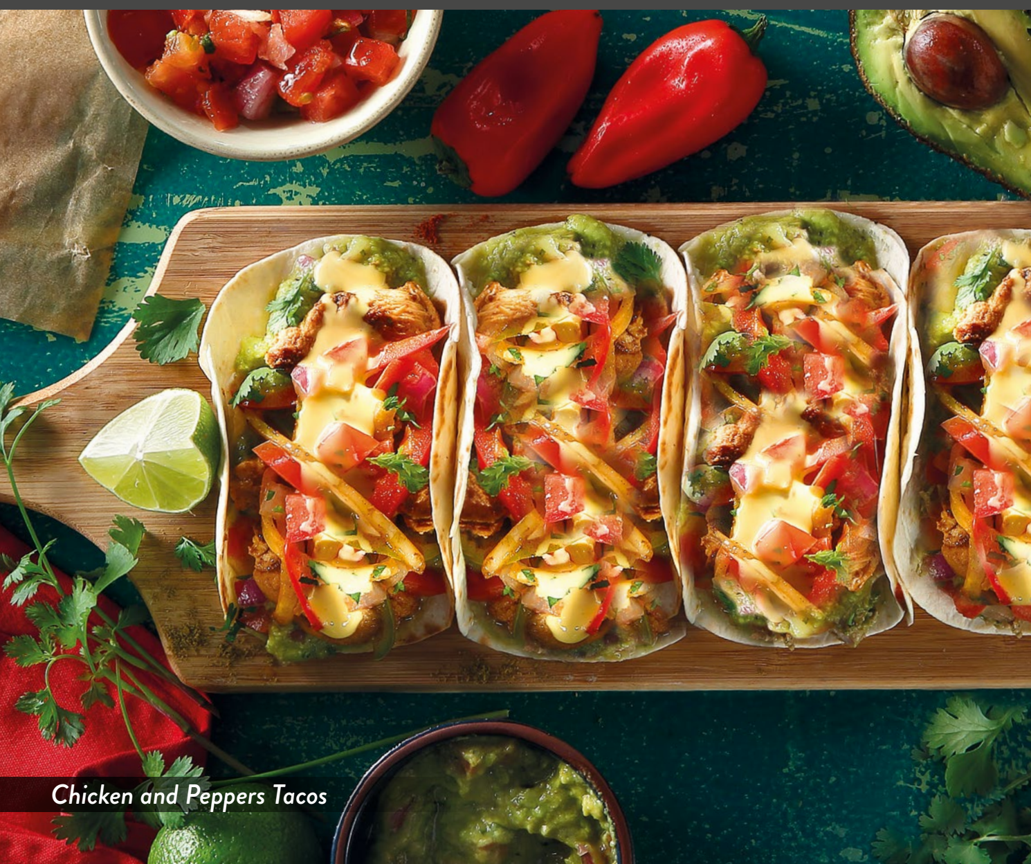
Chicken and Peppers Tacos