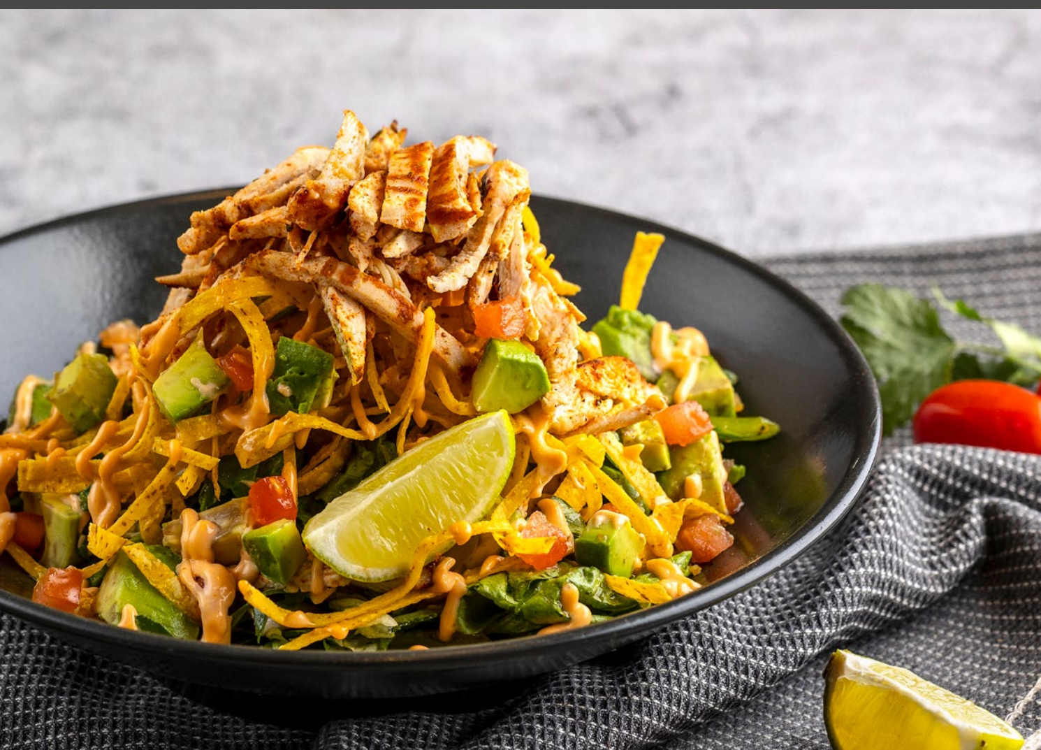
Yucatan Chicken Salad