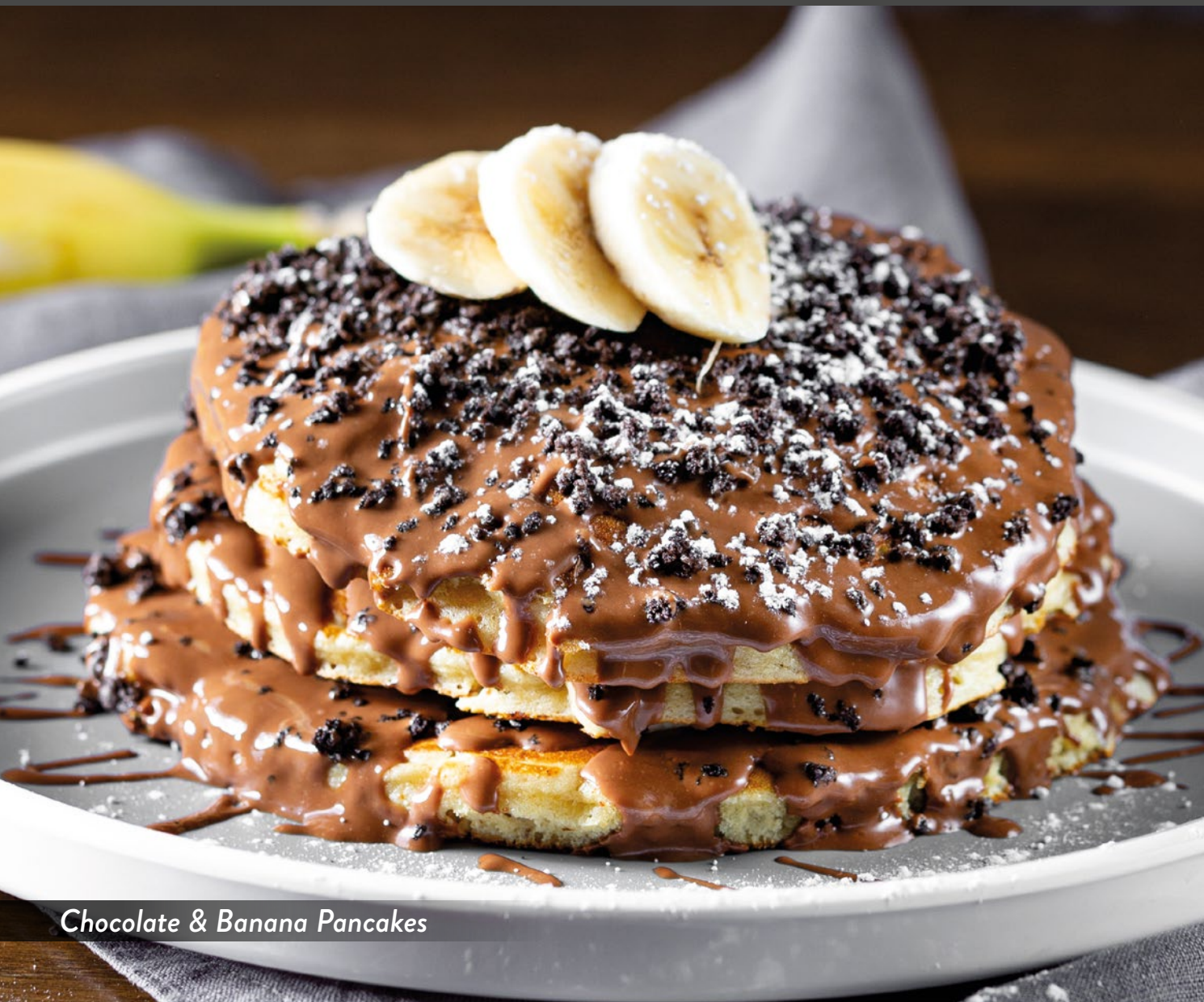
Chocolate & Banana Pancakes